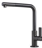
VELA PLUS GUN METAL satiné