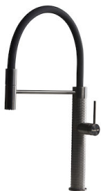
Mitigeur Skin Gun Metal