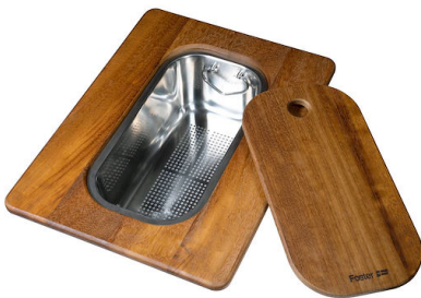
Planche de découpe Twin en bois Iroko avec tamis en acier inoxydable